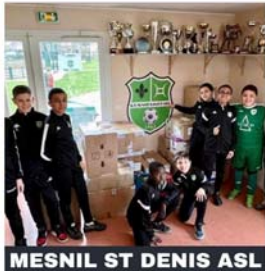
MESNIL ST DENIS ASL