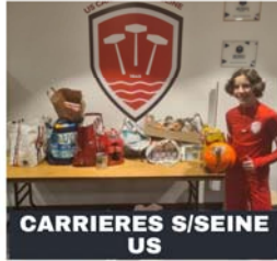
CARRIERES S/SEINE US