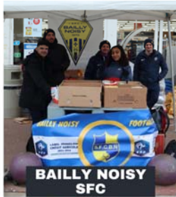
BAILLY NOISY SFC

LA COLLECTE CŒUR DE FOOT S'EST TERMINÉE LE 15 FÉVRIER 2023 ! NOUS VOUS REMERCIONS POUR VOTRE SOLIDARITÉ ET VOTRE ENGAGEMENT POUR LES RESTOS DU CŒUR