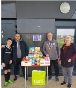
VERNEUIL S/SEINE US