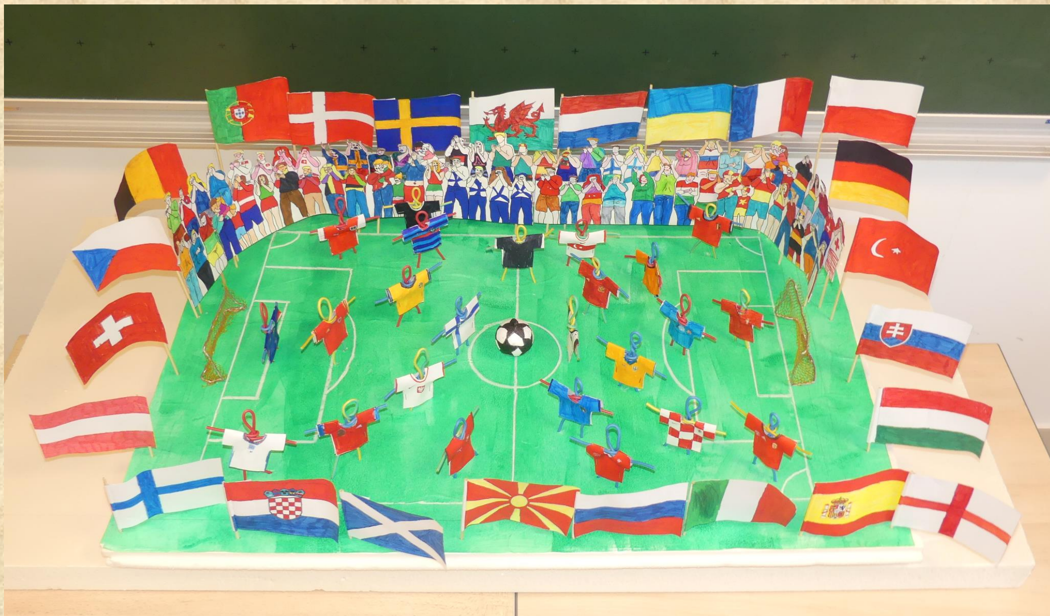
Ecole élémentaire - 78950 GAMBAS - Classe de CE1 - Mme PREVOTEAU